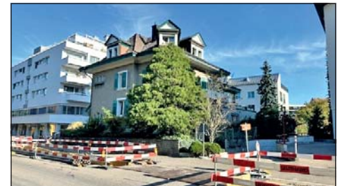
Bestes Beispiel: Oberdorfstrasse 13, ruhig, sauber und freundlich!

Die Liegenschaft ist im Besitz eines institutionellen Eigentümers und derzeit im oberen Bereich weitgehend leerstehend. Der Standort ist zonenkonform und erlaubt somit eine Nutzung als Asylunterkunft gemäss den gesetzlichen Vorgaben. Der Mietvertrag läuft über mindestens zehn Jahre und lässt eine langfristige Planung zu, was für die Stadt angesichts der unsicheren Entwicklung der Aufnahmequote sehr wichtig ist.