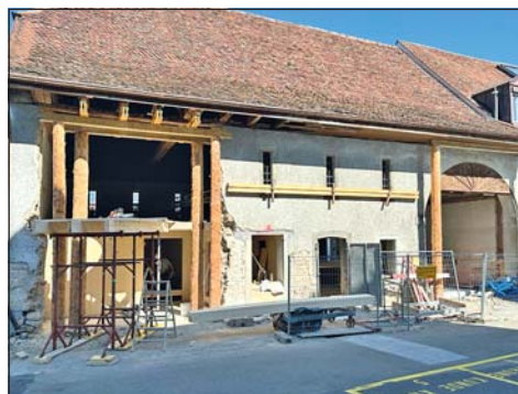
Zehntenscheune im Umbau

Die Märkte sind bei der Standortförderung angesiedelt. Wir arbeiten, wie bereits erwähnt, bereichsübergreifend zusammen und unterstützen uns gegenseitig. Ein attraktives Kulturleben ist auch Standortförderung und trägt zur Lebensqualität bei. Gerade Karl's Kühne Gassenschau hat eine überregionale Ausstrahlung und trägt somit direkt und indirekt zur Wertschöpfungskette bei.