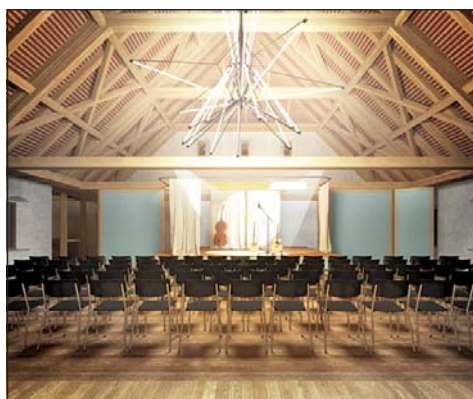
Zehntenscheune von Innen

Die Eröffnung des Gleis 21, dass die Zehntenscheune bald eröffnet wird und dass der Stadtkeller nach all den vielen Jahren immer noch ein beliebter Kulturort ist mit tollen Konzerten.